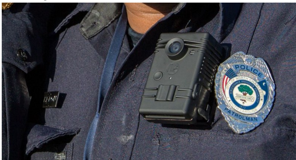
North Charleston police officer with body-worn camera.